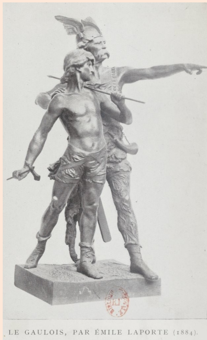
LE GAULOIS, PAR ÉMILE LAPORTE (1884).

Rodzinne miasto Bordeaux uczciło swego Obywatela nazywając jego imieniem jeden z placów, a U.I.T. oraz ISSF zamieściło o nim wzmianki m. in. w swych jubileuszowych publikacjach książkowych, dotyczących historii międzynarodowego strzelectwa. Tekst powstał w dziewięćdziesiątą rocznicę śmierci, twórcy potęgi strzelectwa.