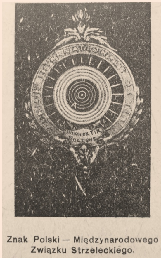
Znak Polski — Międzynarodowego Związku Strzeleckiego.